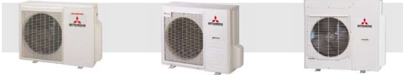
SCM 100~125 ZJ-S1